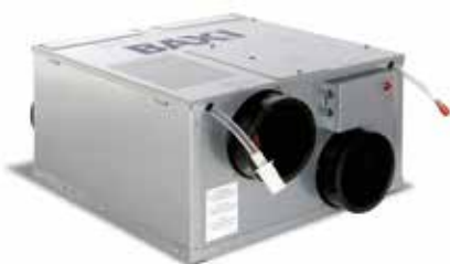
Supercompacto 220 x 396 x 396 mm

Recuperador de calor de alta eficiência (até 92%). Ideal para instalação em apartamentos, quartos de hotel ou locais com área até 80 m².